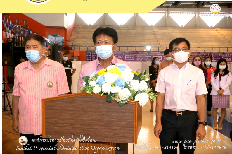
องค์การบริหารส่วนจังหวัดศรีสะเกษ Sisaket Provincial Administrative Organization

เรื่อง : ฝ่าภัยประชสัมพันธ์ อบฯ.ศรีสะเกษ