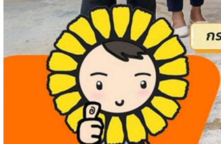
ครูคุณพร้อม!