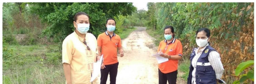
องค์การบริหารส่วนจังหวัดศรีสะเกษ Provincial Administrative Organization www.pao-sisaket.go.th โทรศัทพ์ : 045-814676 โทรสาร : 045-814677