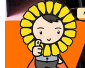
ครูคุณพร้อม!